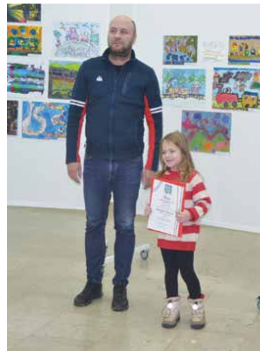
Александров, III-1, Школа са домом за ученике оштећеног слуха и говора „11. мај“, Јагодина;